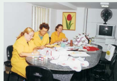
Aulas acontecem na sede do Voluntariado

O Voluntariado do IMIP começa a se preparar para o bazar de Fim de Ano. Pacientes, acompanhantes e funcionários do Complexo Hospitalar que participam da oficina de Conjuntos de Copa, já estão confeccionando panos de prato, de bandeja e capas para botijão de água que serão vendidos durante o bazar. A renda será revertida para as causas defendidas pelo Instituto.