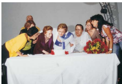
Diretoras comemoraram atuação da FAF