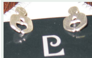
Brincos do IMIP contam com a assinatura do design Leo Pinheiro

Brincos e bottons de prata são os mais novos produtos da grife IMIP. Lançadas no dia 18 de setembro, as peças são assinadas pelo designer de jóias Léo Pinheiro e estão à venda apenas na Lojinha do IMIP localizada na sede da FAF.