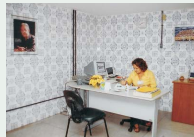
Secretaria do Voluntariado