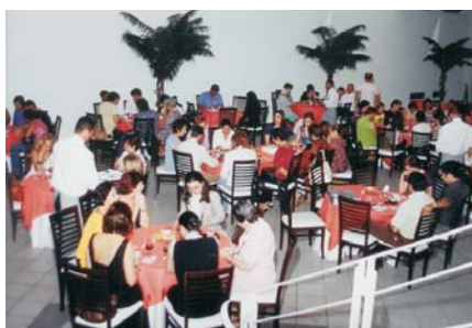
Arcádia esteve lotada durante o evento